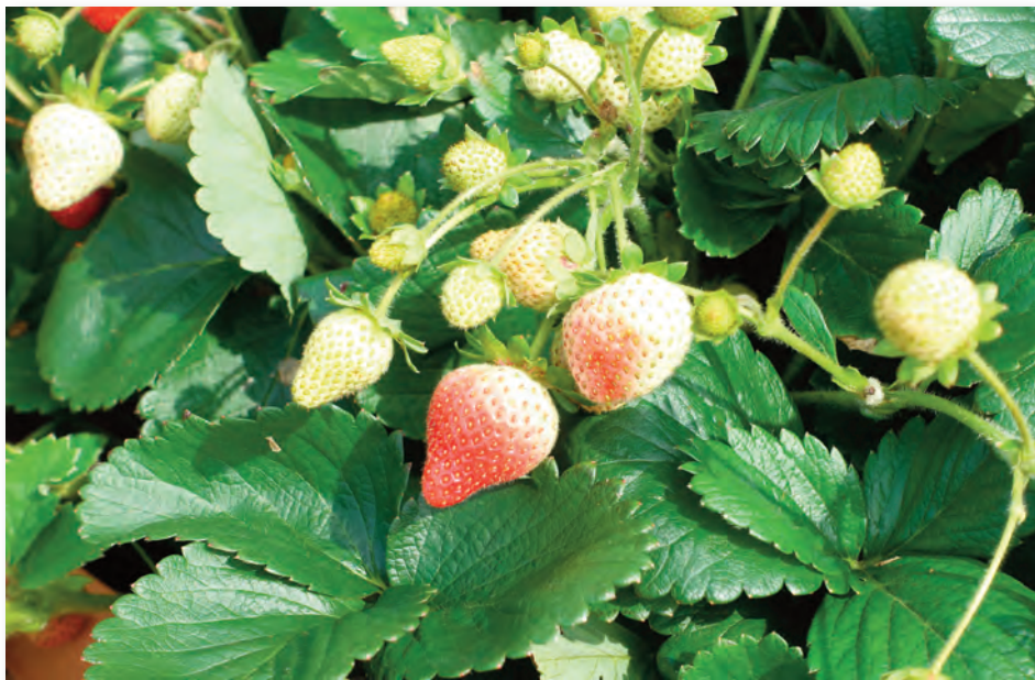
Klassische Erdbeeren reifen im Juni und Juli.

Bei den Beet-Erdbeeren gibt es Klassiker wie 'Mieze Schindler' und 'Senga-Sengana'. Sie haben sich bewährt und sind im Geschmack unübertroffen. Wer diese Erdbeeren im Kleingarten kultiviert, richtet sich im Frühsommer ein Beet dafür her. Als Abstand in der Reihe werden 20 bis 30 cm empfohlen, die Reihen selbst haben einen Abstand von gut 60 cm. Das bedeutet, dass man für zwei Dutzend Pflanzen gut sechs Quadratmeter Fläche benötigt. Beim Pflanzen sollte sowohl der Boden als auch der Wurzelballen gut feucht sein. Grundsätzlich