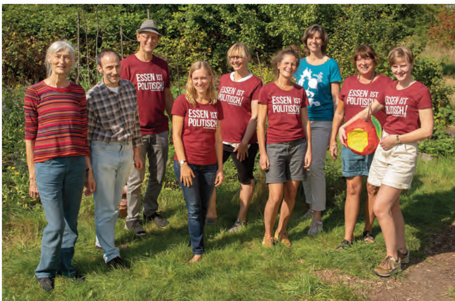
Das Kernteam des Ernährungsrates Essen im Sommer 2020.

Ernährungsräte in ganz Deutschland haben sich gegründet, um dieses Problem an der Wurzel zu packen. Gesunde, frische und regionale Lebensmittel sollen für alle Menschen verfügbar und bezahlbar sein! Während in der EU eine Agrarreform nach der anderen zum Scheitern verurteilt ist, nehmen die Bürgerinnen und Bürger die Agrarwende einfach selbst in die Hand. Ernährungsräte unterstützen lokale Bauern mit Direktvermarktung, fördern solidarische Landwirtschaft, lassen Schulgärten entstehen, schaffen Bildungsangebote und üben politischen Druck aus. Die politischen Rahmenbedingungen in einer Stadt lassen sich über den Stadtrat leichter beeinflussen als die Agrarpolitik der EU-Kommission. Aus diesem Grund haben wir vor zwei Jahren