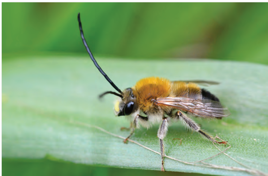
Der Name ist Programm: die Mai-Langhornbiene.

Der Name der Biene des Jahres 2021 sagt schon einiges über sie aus: Sie ist vor allem im Mai aktiv (je nach klimatischen Bedingungen von Ende April bis Anfang Juni). Ab Juni ist die ihr zum Verwechseln ähnlich sehende Juni-Langhornbiene aktiv.