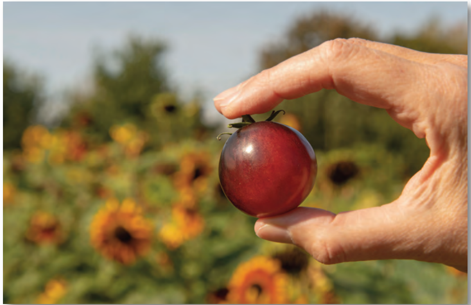
Sonnengereiftes Gemüse von der Bonnekamphöhe im Essener Norden.

Genau hier setzt die Zukunftsküche Essen an. Die Außer-Haus-Verpflegung in Kitas und Schulen, aber auch in öffentlichen