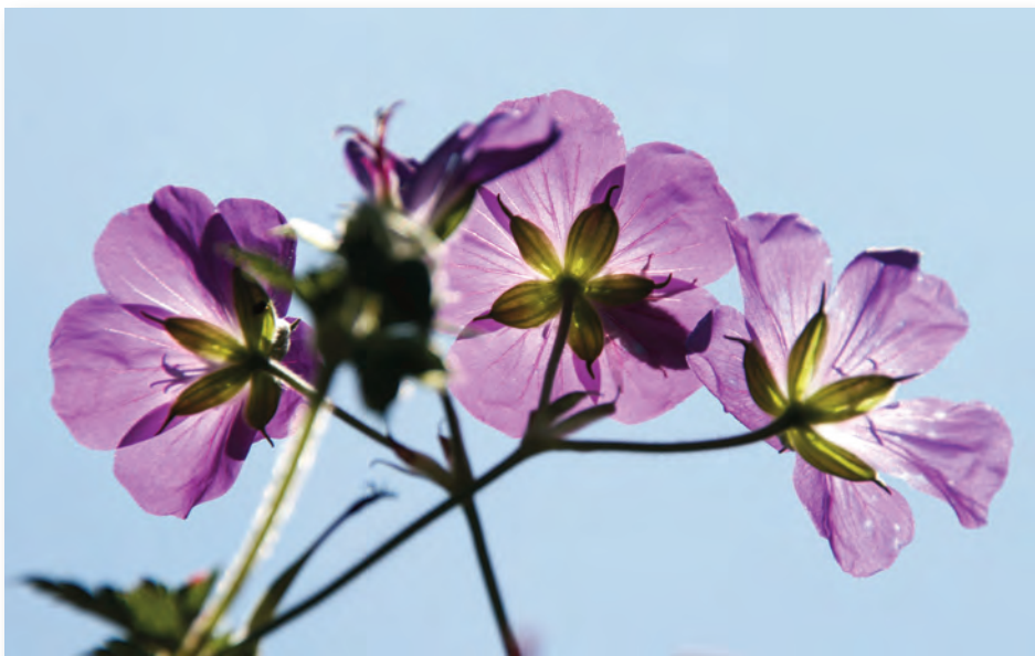
Storchenschnabel 'Rozanne' blüht den ganzen Sommer und ist bei Bienen sehr beliebt. Im Gegenlicht ist auf der mittleren Blüte die Silhouette einer Besucherin zu erkennen.

Je nach Witterung werden in wenigen Wochen bereits einige zeitig blühende Stauden ihre Pracht verloren haben. Die Blütentriebe von Rittersporn, Storchenschnabel und Sterndolde bodentief abschneiden. Anschließend eine kleine Portion Dünger um die Pflanzen verteilen und in etwa sechs Wochen bereichern sie das Staudenbeet mit einer zweiten, allerdings weniger üppigen Blüte. Auch Akeleien und Frauenmantel