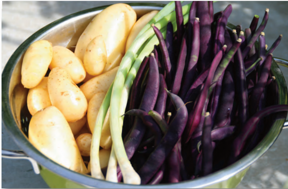
Erntefrisches Trio auf dem Weg in die Küche: Frühkartoffel 'Duke of York', junger Knoblauch und Stangenbohne 'Blauhilde'.

Es ist Zeit für den Sommerschnitt an Obstbäumen, auch „Johanniriss“ genannt. Besonders Apfelbäume, die im Winter stark zurückgeschnitten wurden, profitieren vom Sommerriss. Junge Wasserschosser werden samt „schlafender Augen“ mit einem Ruck ausgerissen. Zur sommerlichen Obstbaumpflege zählt auch das Auslichten der jungen Früchte, die meist zu dicht hängen. Mickrige Exemplare entfernen, so erhalten die übrigen ausreichend Sonne und Nährstoffe und reifen optimal. Steinobstbäume lichtet man unmittelbar nach der Ernte aus, ebenso wie Johannis- und Stachelbeersträucher. Ihre Abschnitte kann man für Stecklinge verwenden. Auf der Webseite des Stadtverbandes finden Sie eine Anleitung zum Sommerschnitt. Freie Flächen im Gemüsebeet mit vorgezogenen Pflänzchen bestücken bzw. nachsäen. Dazu eignen sich schnell keimende Salate in allen Variationen, Rote Bete, Buschbohnen, Fenchel, Lauchzwiebeln, Spinat, Mangold, Grünkohl, Rosenkohl