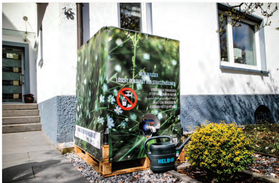
Kostbares Regenwasser wird in Tanks gesammelt.

Hierfür werden gebrauchte 1.000 Liter-IBC-Tanks im gesamten Stadtgebiet bei Ehrenamtlichen, Vereinen, Firmen, sozialen Einrichtungen, Schulen, KiTas, Wohnungsbau-gesellschaften etc. aufgestellt und an Regenfallrohre angeschlossen. Das erforderliche Equipment zur Bewässerung wie Kannen, Fässer, Schläuche, Karren, Warnwesten etc. wird den Bürgern je nach Bedarf gestellt. Grundsatz ist, dass alle Menschen jeden Alters in die Lage versetzt werden sollen, entsprechend ihrer Möglichkeiten mitzuhelfen und unterschiedlichste Teil-