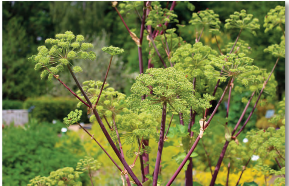
Blütenstände der Engelwurz, Angelica sylvestris 'Vicar's Mead'

In einem Staudenbeet finde ich das recht einfach. Dort schaue ich, dass ich Stauden wie Atern, Anemonen, Katzenminze, Goldschmiele und Storchschnabel, die alle einen lebensfrohen und wüchsigen Charakter haben, etwas in ihre Schranken weise, indem ich sie im zeitigen Frühjahr absteche. Gerade bei der Fetten Henne, die ihrem Namen alle Ehre macht, ist es sinnvoll, alle paar Jahre den Horst zu teilen, um die Standfestigkeit der Pflanze zu erhöhen und Raum zu schaffen. Den freigewordenen Platz kann ich dann im Frühling mit neuen Einjährigen und Stauden bepflanzen, die auf meiner Wunschliste stehen, z.B. der wundervolle, einjährige Knöterich Persicaria 'Kiss me over the gardengate' . Allein des Namens wegen, aber auch, da die zart überhängenden Blüten in luftigen Höhen von Juli bis Oktober durchblühen. Dann müssen unbedingt die eigenen Nachzuchten von En-