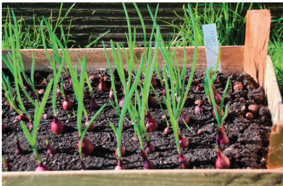
Vorgezogene Zwiebelchen, hier die aromatische rote Sorte 'Red Baron', werden im Frühjahr in die Beete gesetzt. Ganz ungeduldige Küchenchefs dürfen in Maßen frische Triebspitzen ernten.

An frostfreien Tagen bis etwa Mitte März ist Gelegenheit, Kernobstbäume auszulichten. Für alle Pächter, die ihre ehrwürdigen, alten Obstbäume nicht aus purer Unkenntnis verstümmeln wollen, veranstaltet der Stadtverband Praxisseminare in den Vereinen (Siehe Seite 15). Wenn man auf dem Weg zu den Gemüsebeeten nicht mehr knöcheltief durch Matsch waten muss, macht Unkraut zupfen zur Vorbereitung für erste Kulturen Sinn. Unbedingt abräumen, es wächst sonst wieder an. Traditionell kommen Dicke Bohnen, auch als Sau-, Puff- oder Ackerbohnen bekannt, als eine der allerersten Saaten in den nächsten Wochen in die Erde. Ihnen macht die Kälte nichts aus – im Gegensatz zu ihren wärmeliebenden Verwandten, den Busch-, Stangen- und Feuerbohnen. Sie bleiben noch bis Ende März in ihren Saat-