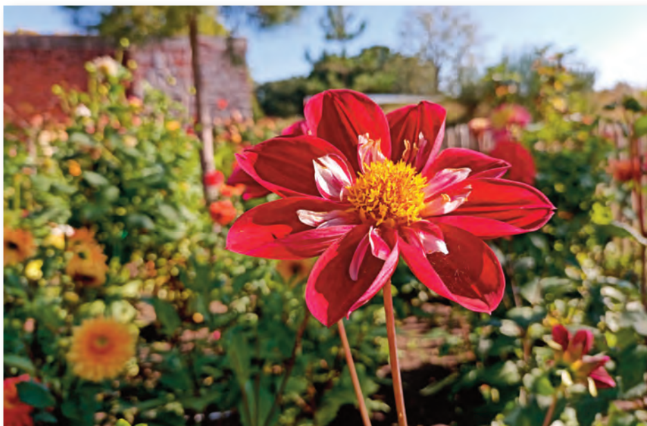
Die ungefüllten Blüten der Dahlia pinnata bieten Insekten Nahrung.

Die Anbauplanung für Gemüse ist etwas herausfordernder. Hier sollte der Kulturwechsel beachtet werden, damit Krankheitserreger und Schädlinge weniger Schaden anrichten können und die optimale Nährstoffversorgung gewährleistet ist. Von Stark-, Mittel- und Schwachzehrern hat jeder schon mal was gehört. So gehören beispielsweise alle Kohlsorten, Kartoffeln, Gemüfefenchel, Kürbisse, Gurkengewächse und Sellerie zu Starkzehrern. Deswegen bereite ich den leckeren Kartoffeln der Sorte 'Bamberger Hörnchen', deren Knollen etwas bananenförmig wachsen und deren nussiges Aroma ich in Salaten sehr liebe, in diesem Jahr ein neues Beet vor. Dazu steche ich etwas Rasenfläche ab. Kartoffeln sind bodenlockernd und als Erstbesatz für ein neues Beet bestens geeignet. Hier stehen ihnen noch alle Nährstoffe eines unverbrauchten Bodens zur Verfügung. Der ebenfalls sehr stark zehrende Rhabarber bekommt jeden Herbst eine Fuhre Kompost, der stark verrottet ist. Während der Wachs-