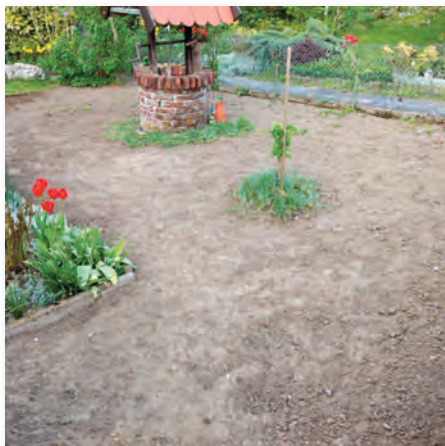
Die alte Grasnarbe ist abgezogen. Ältere Krokusbestände bleiben im Boden.

Als ich meinen Garten nach und nach in ein Tierparadies verwandelte, war die augenfälligste Veränderung der Blumen-/Kräuterrasen (nachfolgend: Blumenrasen). Ein Blumenrasen ist ein wahrer Insektenmagnet: Grashüpfer singen (für uns Laien: Grillen zirpen), Käfer krabbeln, Schwebfliegen schwirren, Schmetterlinge gaukeln und Bienen summen darin. Allerdings erfordert die Anlage eines Blumenrasens ziemlich viel Geduld, und das ein ganzes Jahr lang. Aber es lohnt sich, wenn man außerdem die Mühe nicht scheut, die Grasnarbe der gewünschten Fläche abzutragen und den Blumenrasen neu anzulegen. Denn einfach etwas Saatgut in den vorhandenen Rasen zu streuen, funktioniert nicht: Die Hochleistungsgräser des vorhandenen Rasens geben den Wildkräutern keine Chance.