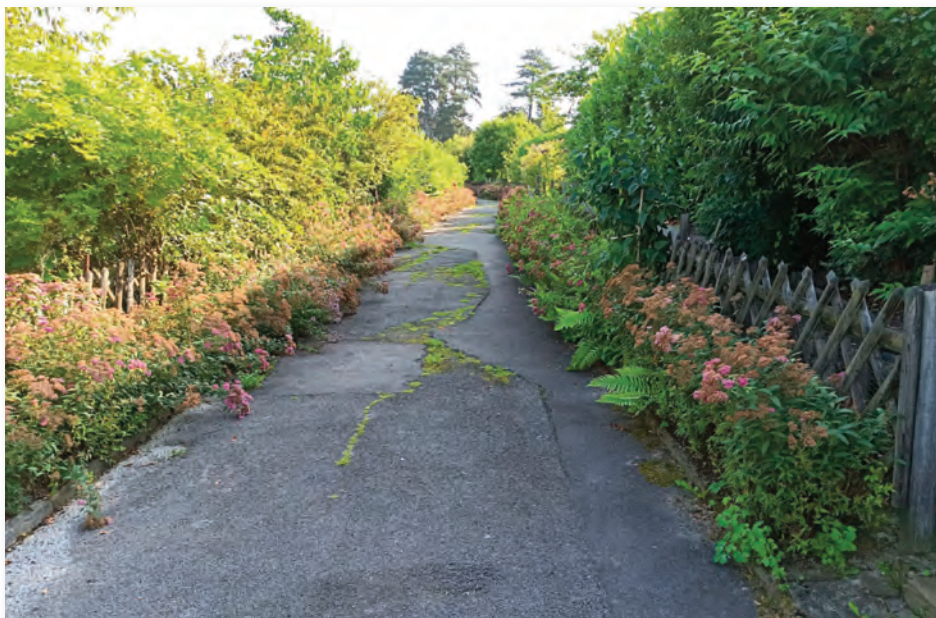
Die Asphaltdecke war in die Jahre gekommen. Ihr Zustand verschlechterte sich mit jedem Starkregenereignis und jedem frostigen Wintertag.

Seit September 2023 haben wir einen grünen Weg in der Gartenanlage! Er nimmt das Regenwasser auf und reguliert wunderbar die Temperatur in der unmittelbaren Umgebung. Unser Projekt ist vielleicht eine Inspiration für andere Vereine mit ähnlichen Wegesituationen.