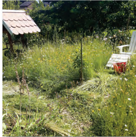
Staffelmahd mit Sichel

Sense. Gemäht wird in Teilabschnitten (Staffelmahd), um den Insekten Fluchtmöglichkeiten zu geben. Das Schnittgut bleibt noch ein paar Tage auf der Fläche liegen, bis es durchgetrocknet und nachgereift ist, sodass die Samen herausfallen können. Dann wird es abgetragen, damit die Fläche keine zusätzlichen Nährstoffe erhält. Aus dem Schnittgut kann man jetzt Mulchwürste à la Markus Gastl vom Hortusnetzwerk „drehen“. Diese können in der Anbaufläche zwischen den Pflanzen verwendet werden. Der Vorteil gegenüber einer normalen Mulchschicht: Die Mulchwürste lassen sich leicht hochheben, um die darunter liegenden Schnecken abzusammeln und es sieht etwas ordentlicher aus ;-).