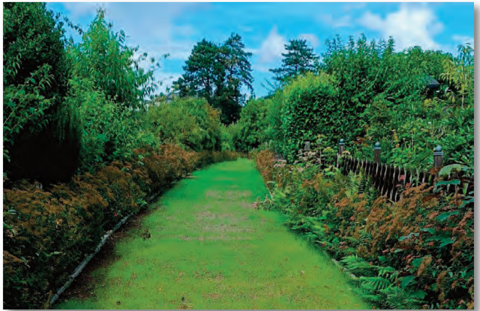
Der neue Weg durch die Anlage an der Trappenbergstraße besteht aus pflegeleichtem Schotterterrassen und wurde von den Gartenfreunden in Gemeinschaftsarbeit angelegt.

Daher beschloss der Verein, den Weg zu sanieren. Dank der finanziellen Unterstützung des Stadtverbandes Essen der Kleingärtnervereine e.V. und der Stadt Essen haben wir im Dezember 2021 mit der Sanierung begonnen. Mit Radlader und kleinem Bagger haben wir angefangen, die Teerschicht zu entfernen und in die Container zu laden. Im Frühjahr 2022 ging es mit dem