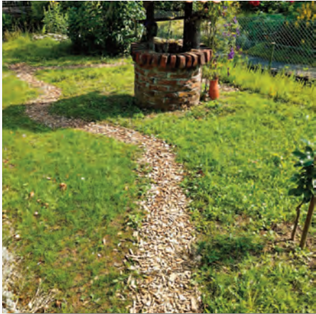
Ungleichmäßiger Wuchs im ersten Jahr

geschlossen ist, Schröpfschnitte durch. In der Literatur ist dabei von Sichel und Sense die Rede, ein Test mit meinem Rasenmäher und mit höchster Einstellung ergab, dass er die gewollten Pflanzen nicht rauszog und deshalb gut verwendet werden konnte. Nun wird immer gemäht, wenn der Bewuchs etwa zehn Zentimeter hoch ist. So entsteht im ersten Jahr eine dichte Grasnarbe.