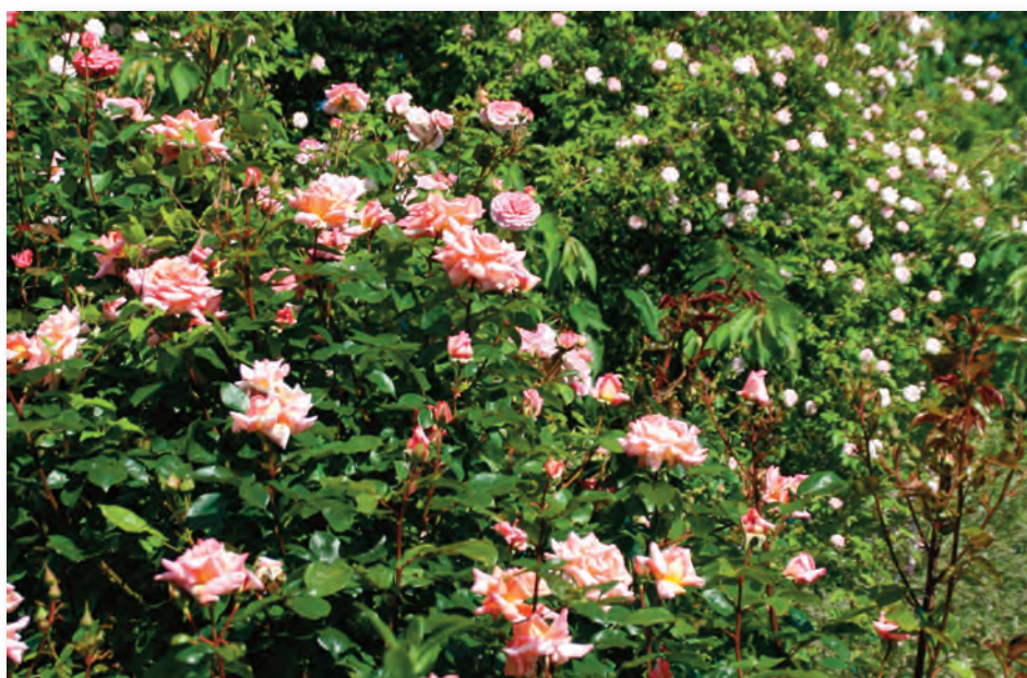
Im Rosenmonat Juni entfaltet die Königin der Blumen ihre ganze Pracht – vorausgesetzt, sie wurde im Frühjahr richtig geschnitten. Wer unsicher beim Wann und Wie ist, sei die Teilnahme am Seminar „Rosenschnitt“ ans Herz gelegt.

In den Staudenbeeten geht es noch gemächlich zu. Pflanzen, die von innen verkahlt sind, werden in den kommenden