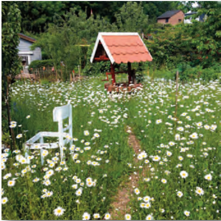
Die Hoch-Zeit der Margeritenblüte

geschlossen ist, Schröpfschnitte durch. In der Literatur ist dabei von Sichel und Sense die Rede, ein Test mit meinem Rasenmäher und mit höchster Einstellung ergab, dass er die gewollten Pflanzen nicht rauszog und deshalb gut verwendet werden konnte. Nun wird immer gemäht, wenn der Bewuchs etwa zehn Zentimeter hoch ist. So entsteht im ersten Jahr eine dichte Grasnarbe.