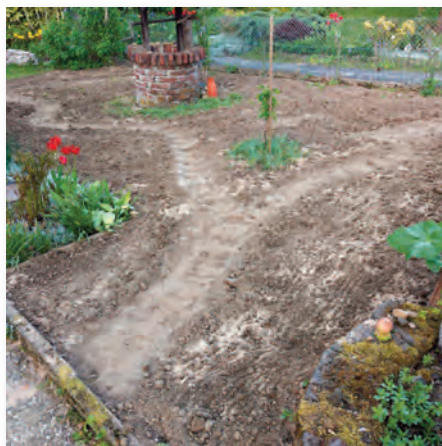
Wege werden ausgehoben.

den ist stark lehmhaltig, sodass ich ihn mit Sand etwas durchlässiger und magerer gemacht habe. Mit einem Rechen wird die möglichst feinkrümmelige Erde gleichmäßig verteilt. Nun heißt es gute zwei Wochen zu warten, damit der Boden sich setzen kann. In dieser Zeit sollte man sich überlegen, ob man Wege, die durch den Blumenrasen führen, anlegen möchte. Eigentlich ist der Blumenrasen trittfest, aber wer bringt es schon übers Herz, wenn im Mai die ersten Margeriten rausschauen, auf diesen herumzutrameln? Um diesem Gewissenskonflikt zu entgehen, habe ich Hackholzschnitzelwege angelegt. Mit Sand kann man die Wege in der Fläche planen, dann wird der Boden etwas ausgehoben und es kommen die Hackholzschnitzel darauf. Dabei natürlich tunlichst nicht auf die Fläche des vorbereiteten Blumenrasens treten.