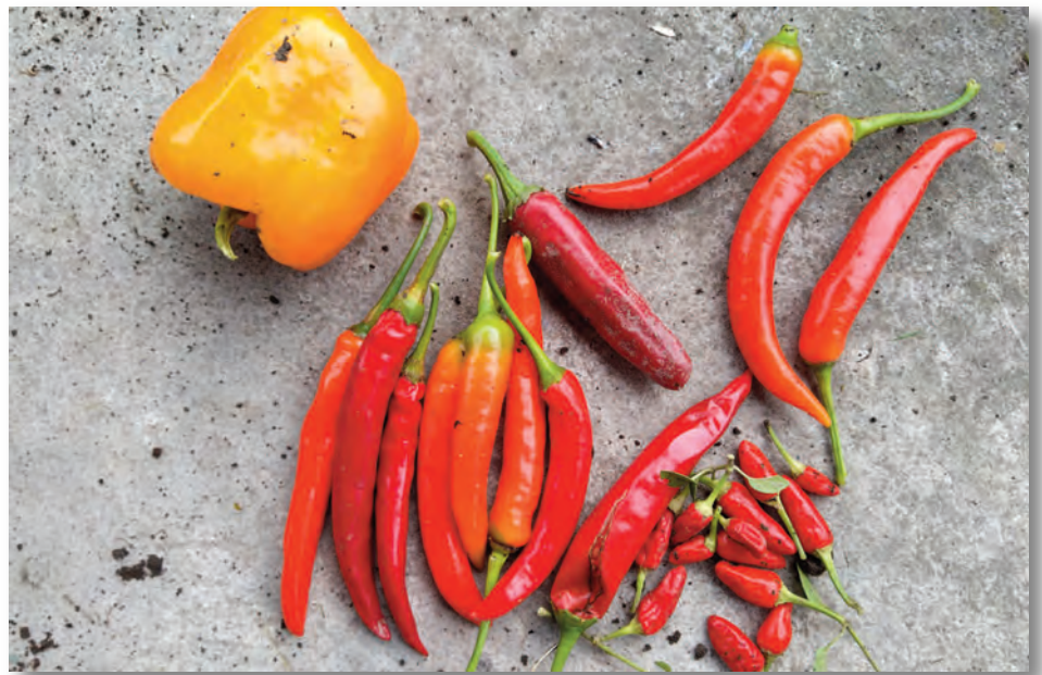
Chilis gibt es in allen Formen und Farben – und nicht zu vergessen: Schärfegraden!

Und dann erinnere ich mich noch mit Freude an den Besuch eines alten, britischen Landhauses, in dessen Gärten in den Gewächshäusern Melonenanbau betrieben wurde. Eigens für jede Melone wurde ein Netz an den First des Gewächshauses gehangen. So wurde das Gewicht der Frucht im wahrsten Sinne des Wortes in einem Netz aufgefangen. Es war ein schöner Anblick und die Ranken hingen übervoll mit saftigen orangen Bällen. Melonen sind mein Gartenexperiment 2024. Allen, die auch