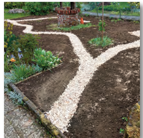
Hackholzschnitzel als Wegedecke

Die Ansaat erfolgt im März oder April, wobei das Saatgut eine zertifizierte heimische Wildsamenmischung sein sollte. Man mischt das Saatgut mit leicht feuchtem Sand. Dann teilt man die sorgfältig gemischte Menge auf zwei Eimer auf. Mit dem ersten sät man in Querrichtung. Kommt man mit der Menge nicht aus, nimmt man die noch benötigte Menge aus dem zweiten Eimer. Danach sät man den Rest des zweiten Eimers in Längsrichtung aus. Da die meisten angesäten Pflanzen Lichtkeimer sind, wird das Saatgut nicht untergereicht, sondern nur angedrückt. Dies geht am besten mit einer Rasenwalze. Wegen der Hanglage und der kleineren Flächen habe ich dafür einen Erdstamper verwendet. Es können aber auch Schaufel oder Bretter genutzt werden.