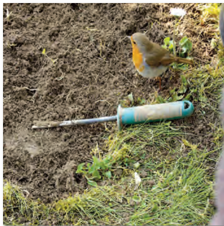
Das Rotkehlchen wartet auf den Wurm.

Ist die Grasnarbe abgetragen, wird der Boden tiefgründig aufgelockert, zum Beispiel mit einer Gartenkralle. Mein Gartenbo-