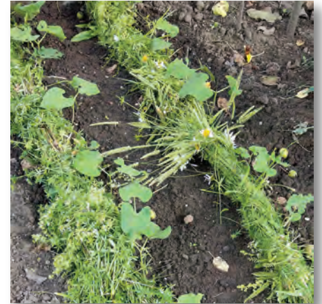
Mulchwürste à la Hortusianer Markus Gastl

Das Bild des Blumenrasens ändert sich von Jahr zu Jahr. Bei zirka 30 verschiedenen Pflanzenarten werden sich je nach Standort bestimmte Sorten etablieren, man-