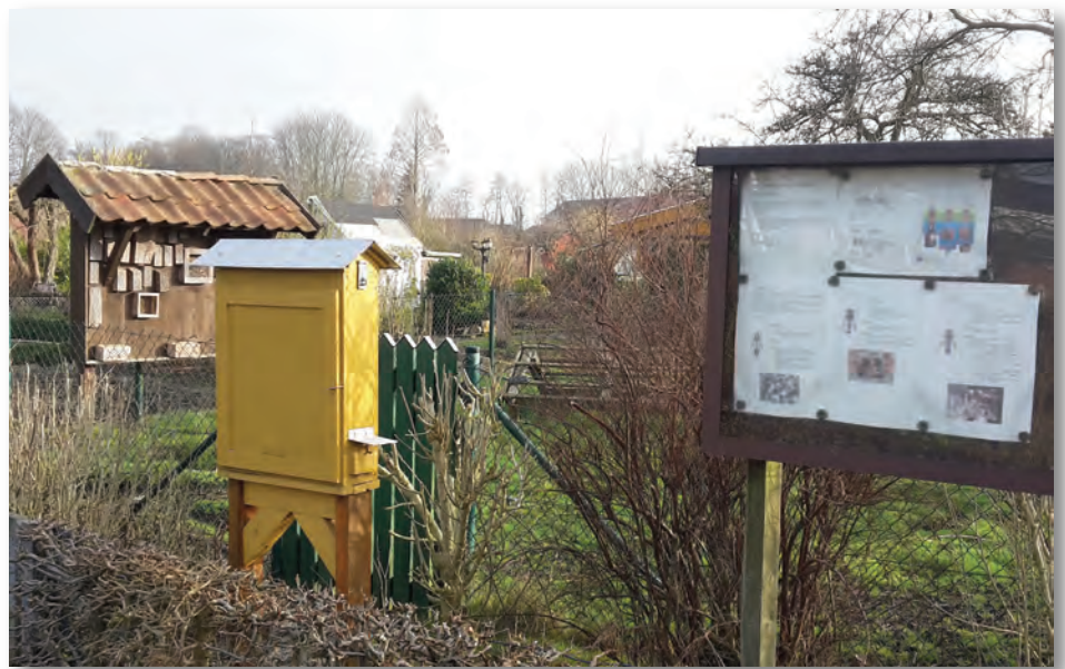
Besucher der Anlage in Münster finden Informationen zu den Bienen und ihrer Lebensweise in einem Schaukasten. In einem kleinen Bienenkasten können sie ein Volk „bei der Arbeit“ beobachten – die Tür lässt sich öffnen, die Bienen bleiben hinter einer Scheibe ungestört.

Hat man den Einsteigerkurs erfolgreich absolviert, wählt man „seine“ Honigbienenrasse aus. Die am stärksten in Deutschland verbreitete Rasse ist die Carnica-Biene , die ursprünglich u.a. aus dem Kärntener Bereich stammt. Außerdem werden vielfach auch sogenannte Buckfast-Bienen (Kreu-