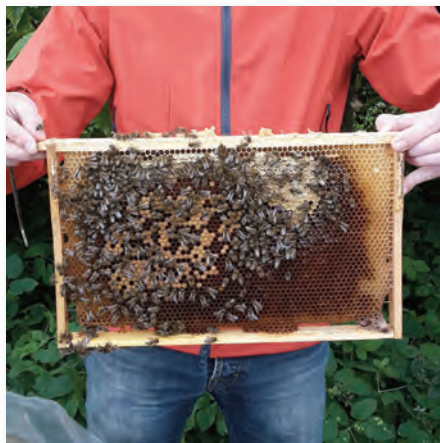
Friedlich tummeln sich die Bienen auf den Waben – aber nur erfahrene Imker öffnen den Bienenkasten ohne Schutzkleidung!

Grundsätzlich sind bei der Haltung von Bie-