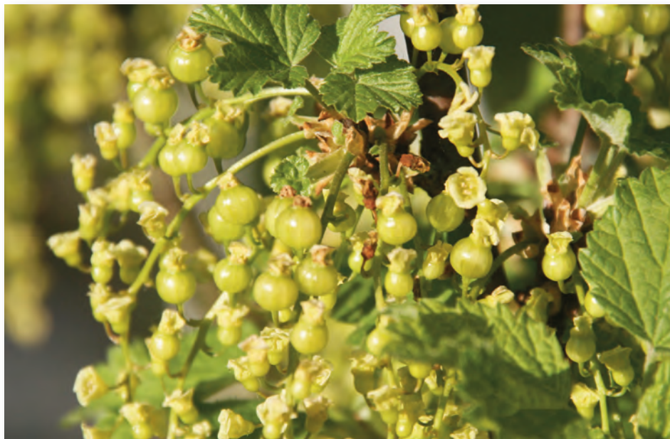
Johannisbeeren haben jetzt bereits Früchte angesetzt. Mitte bis Ende Juni sind sie reif. Die Sorte „Weiße Versailler“ beispielsweise ist zuckersüß. Man erhält sie als Strauch oder Hochstämmchen – was nicht nur schön aussieht, sondern auch sehr bequem zu pflegen ist.

Im Nutzgarten begutachten wir die Schäden, die der lange, kalte Winter angerichtet hat. Erfrorenes von mediterranen Kräutern wie Rosmarin, Thymian, Salbei und Majoran zurückschneiden. Wenn die Schäden nicht zu groß sind, erholen sich die Pflanzen in der Regel wieder. Ein pflegender Rückschnitt um diese Zeit ist generell gut für die Pflanzen. Mit Nach- oder Neupflanzungen warten, bis der Boden abgetrocknet ist und sich in der Frühlingssonne erwärmt hat. Das kann man beschleunigen, indem man das Beet mit schwarzem Vlies abdeckt. Die Sonne erwärmt die dunkle Fläche schneller, das Vlies hält die Wärme im Boden. Starkwüchsige Kräuter wie Minze und Zitronenmelisse vergräbt man am besten samt