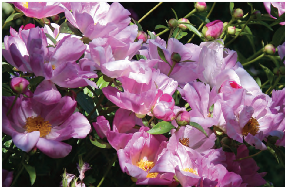
Blüten der ungefüllten Pfingstrosen sind für unsere Bestäuber-Insekten leichter zugänglich und ergiebiger als die prachtvoll „gerüschten“ Exemplare der gefüllten Sorten.

aufbereitet wurde. Beinwell hält Kartoffeln gesund und versorgt sie kontinuierlich mit Kalium, das im Laufe des Vorrottungsprozess freigesetzt wird und wichtig für die Knollenbildung ist. Über die nächsten Wochen immer wieder anhäufeln. Vorgezogenes Gemüse aus dem Gewächshaus – und auch einjährige Sommerblumen – bei milden Temperaturen ans Leben im Freien gewöhnen. Bohnen vertragen keinen Kälteschock. Sie stellen danach aus Protest erstmal das Wachstum ein. Bis sie sich dann wieder zum Weiterwachsen „bequemen“, dauert es eine Weile ... der Wachstumsvorsprung durch die Anzucht ist verloren. Triebspitzen von Erbsen oberhalb des dritten Blattpaars abknipsen. Die Pflanzen verzweigen sich, wachsen buschiger und tragen später mehr Schoten. Robustere Gemüsesorten wie Spinat, Mangold, Rote Bete oder Schnitt- und Pflücksalate können jetzt schon ins Freiland gesät werden. Alle wärmeliebenden Pflänzchen wie Tomate, Gurke, Paprika, Chili, Aubergine, Zucchini und Kürbis unbedingt erst nach den „Eisheiligen“, die bis Mitte Mai noch unangenehme Bodenfröste bringen können, in die Beete pflanzen. Ist der Boden warm genug, können im Ziergarten auch wieder Gräser gepflanzt werden. Ihre Wurzeln sind so fein, dass sie in kalter, nasser Erde nicht anwach-