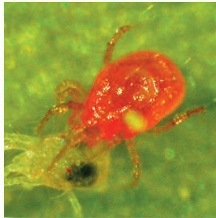
Die Raubmilbe Phytoseiulus persimilis bei der „Arbeit“.

Zum Glück gibt es auch natürliche Gegenspieler dieser Pflanzenschädlinge: Dies sind die Raubmilben , die sich u.a. von Spinnmilben ernähren. Eine herausragende Bedeutung hat hierbei die Raubmilbe Typhlodromus pyri . Diese