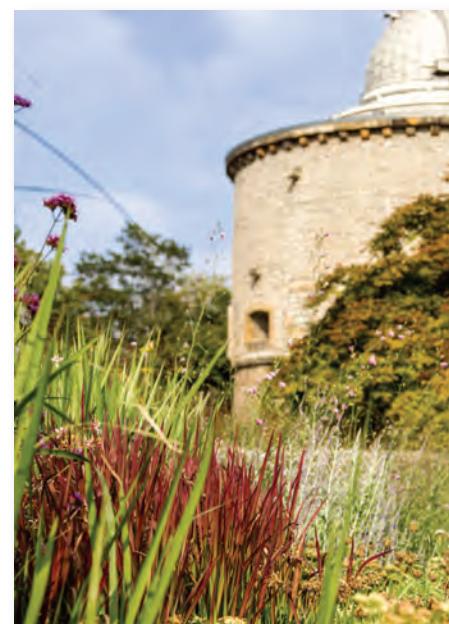
Sternwarte in der Cyriaksburg.

Und – für mich das Sahnehäubchen – es gibt auch noch eine Sternwarte in dem Geschossturm der alten Cyriaksburg mit einer drehbaren fünf Meter