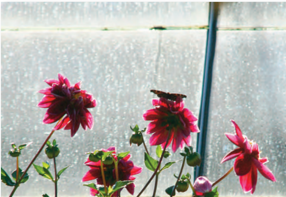
Im Glashaus ist ein gründlicher Herbstputz nötig, um die Scheiben von Schmutz zu befreien. Die Dahlien freuts - denn sie werden noch ein paar letzte sonnige Tage darin verbringen dürfen.

Der Ziergarten wird schon aufs Frühjahr vorbereitet, denn Blumenzwiebeln müssen bis zum Jahresende in die Erde. Pflanzanleitung beachten! Jetzt ist die richtige Zeit, um Staudenbeete neu zu gestalten und „blühfaul“ gewordene Beetbewohner zu teilen und umzusetzen. Sträucher und Hecken dürfen nun wieder kräftig geschnitten werden, damit sie im nächsten Jahr schön in Form sind. Neupflanzungen wachsen im noch warmen Boden gut an. Im ersten Jahr nach der Pflanzung unbedingt regelmäßig gießen. Alle frostempfindlichen Pflanzen ziehen so langsam ins Winterlager. Mit Etiketten versehen, sonst fängt im Frühjahr das große Rätselraten an. Herabgefallene Blätter zusammenharken und als Schutzdecke um Pfingstrosen, Hortensien, Azaleen und Rhododendren verteilen. Diese Pflan-