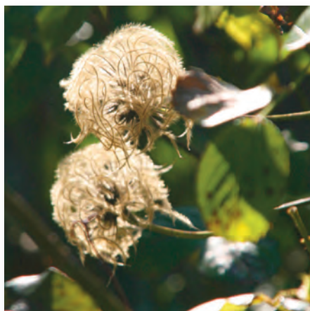
Die filigranen Samenbälle von Clematisblüten sehen in der Herbstsonne aus wie kleine Kunstwerke.

Sämereien , frostempfindliche Flüssigkeiten und Akkus für Gartengeräte ziehen aus dem Gerätehäuschen in ge-