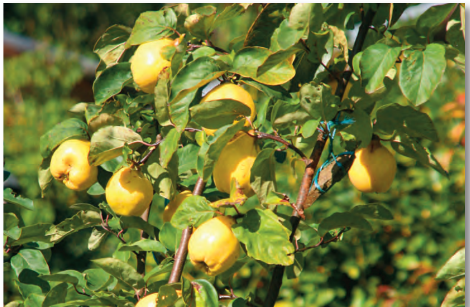
Reife Quitten leuchten weithin sichtbar – ihre Ernte und die Verarbeitung zu Gelee oder Sirup lohnt sich, auch wenn sie etwas mühsam ist.

Im Nutzgarten ist die Obsternte nahezu abgeschlossen. Goldgelbe Quitten und spät reifende Apfelsorten wandern als Letzte in die Erntekörbe. Quitten sind erntereif, wenn sich die Schale gelb färbt. Nicht zu lange am Baum hängen lassen, ihr Fruchtfleisch wird sonst bräunlich. Sie verströmen in der Wohnung einen unvergleichlichen Duft, bevor sie zu Gelee und Quittenbrot verarbeitet werden – roh sind sie leider ungenießbar. Möhren , Rote Bete und Kürbis möglichst lange in der Erde bzw. an der Pflanze belassen, jedoch vor dem ersten Frost ernten. Sie wachsen in diesen Wochen noch ordentlich. Hat man reichliche Ernte, lagert man Möhren und Rote Bete in einer Kiste mit feuchtem Sand in der Laube. Kürbis ist bei 8 bis 10 °C wochenlang lagerfähig.